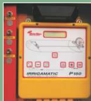
Painel eletrônico de controle de velocidade